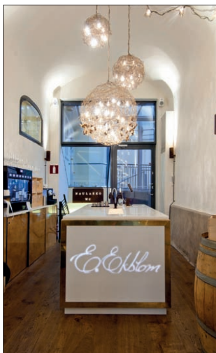
Taustavalaistu jyrsitty logo Corian baaritis-kissä. Viiniravintola E. Ekblom.