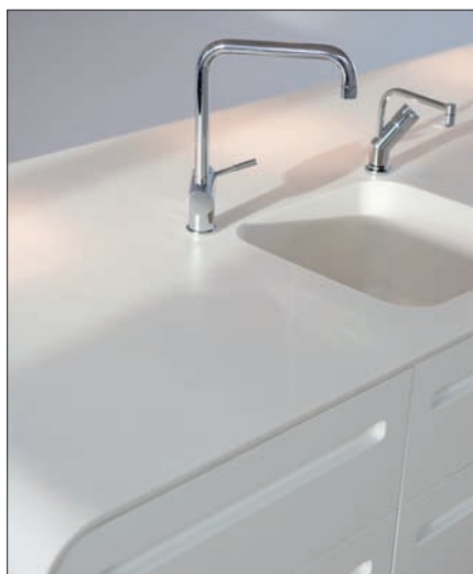
Keittiötasot ja altaat