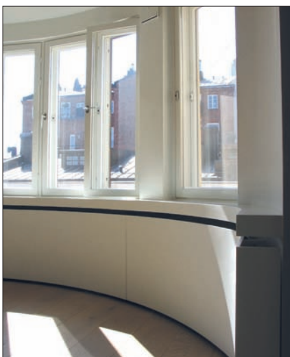
Ikkunapenkit ja patterinsuojat