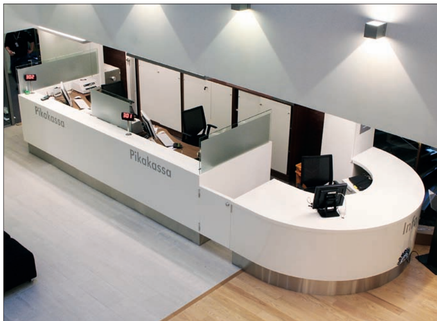
Pankin asiakaspalvelutiski, Turku.

CORIAN® on muotoiltavissa moniin muotoihin, se on työstettävissä kuten kova puu ja sitä voidaan lämpömuovata. Saumat viimeistellään lähes näkymättömiksi ja ne ovat tiiviit ja kestävät. CORIAN® mahdollistaa monenlaiset yksilölliset sisustusratkaisut, joissa monien materiaalien muokattavuudelle tulee rajoja. CORIAN® sisustusmateriaalin teknologia-kehitykseen panostetaan jatkuvasti, ja designmaailman edelläkävijät hyödyntävät sen lukemattomia mahdollisuuksia. Esimerkiksi läpikuultavat CORIAN® värisävyt mahdollistavat erilaisten pintojen tai tuotteiden taustavalaistut.