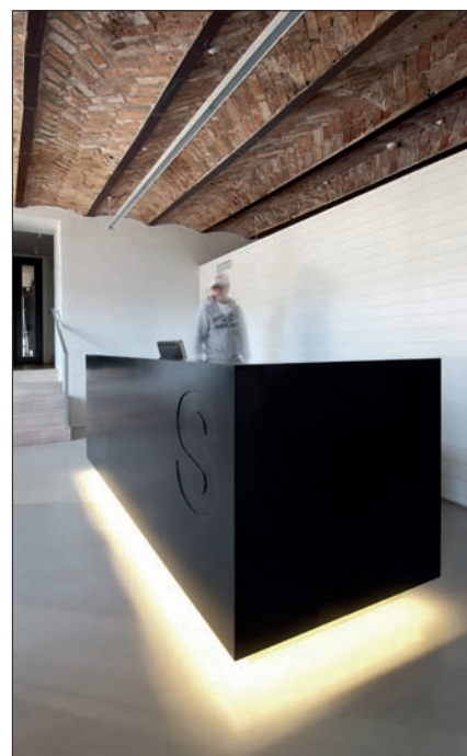
Vastaanottotiski, Mainostoimisto Satumaa.